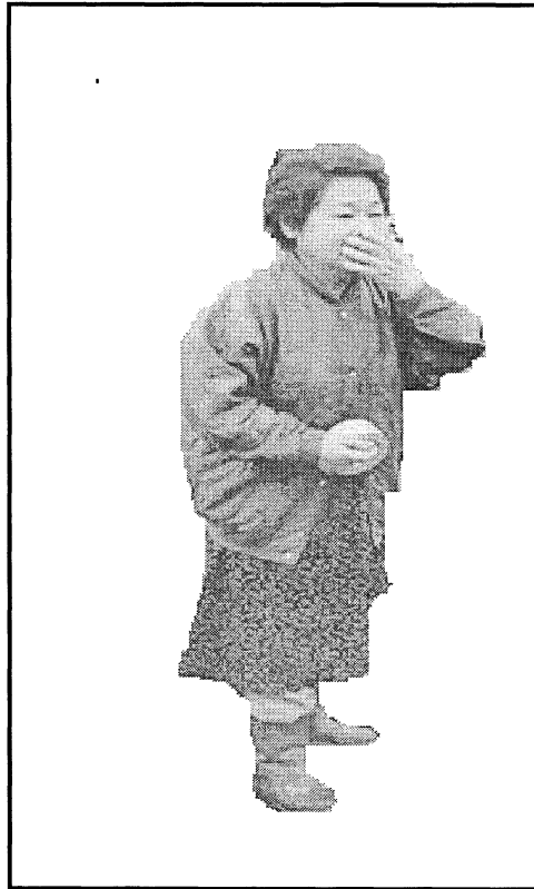
[Aangepas uit: Die Burger , Maart 2011]